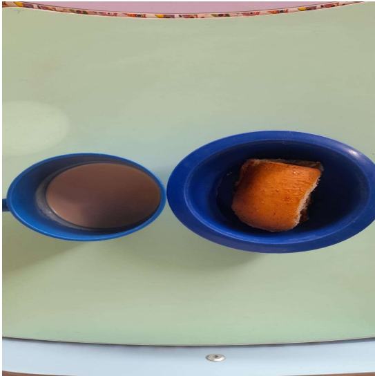
Café da Manhã: pão com geléia e Leite batido com polpa de mamão adoçado com uva passa

08. Garantir uma alimentação saudável, de qualidade e com boa apresentação a 100% (cem por cento) das crianças atendidas, segundo o disposto no Programa de Alimentação Escolar (PNAE);