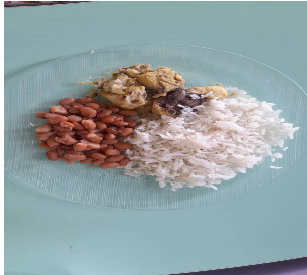
Almoço: Arroz, Feijão, Peixe ao Molho

09. Garantir condições, ambientes e conservação dos espaços adequados para o bem-estar e o desenvolvimento integral de todas as crianças atendidas;